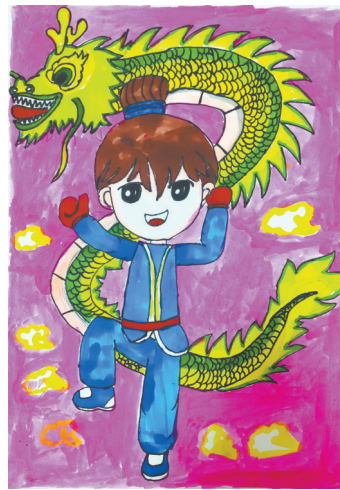
龙的传人 光明路小学教育集团三(9)班 陶晗研