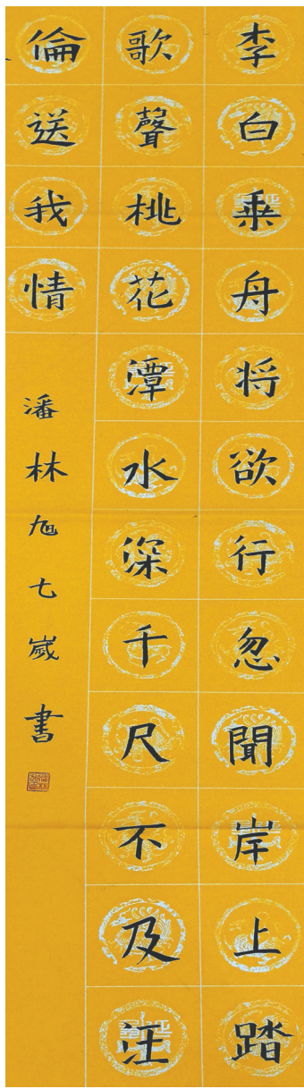
书法作品 光明路小学教育集团二(2)班 潘林旭 指导老师:杨世靖