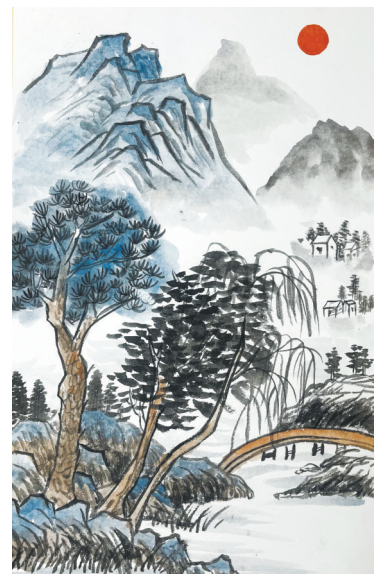
夏日山居 光明路小学教育集团二(1)班 周子童 指导老师:郝晓雯