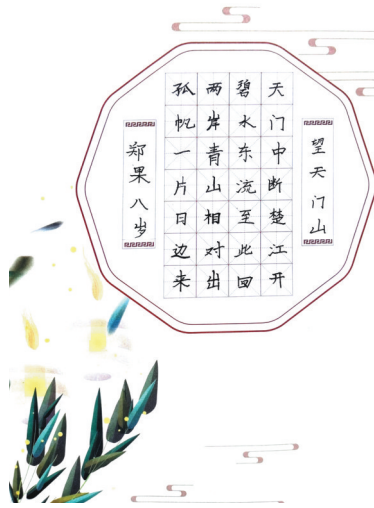
书法作品 光明路小学教育集团二(1)班 郑果 指导老师:郝晓雯