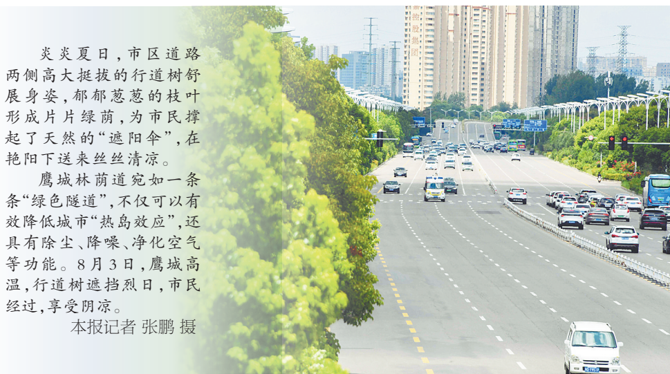
建设路西段，香樟树枝叶葱茏。