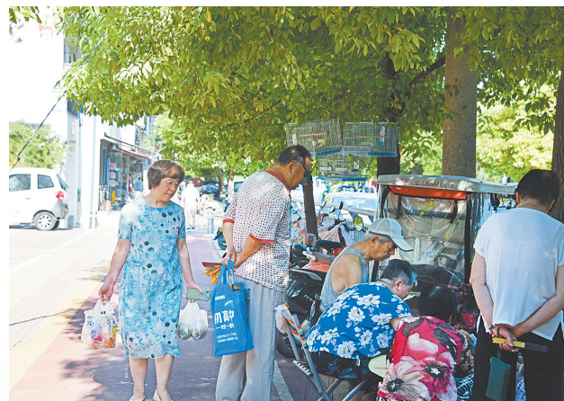
曙光街街头，市民在树荫下休闲娱乐。