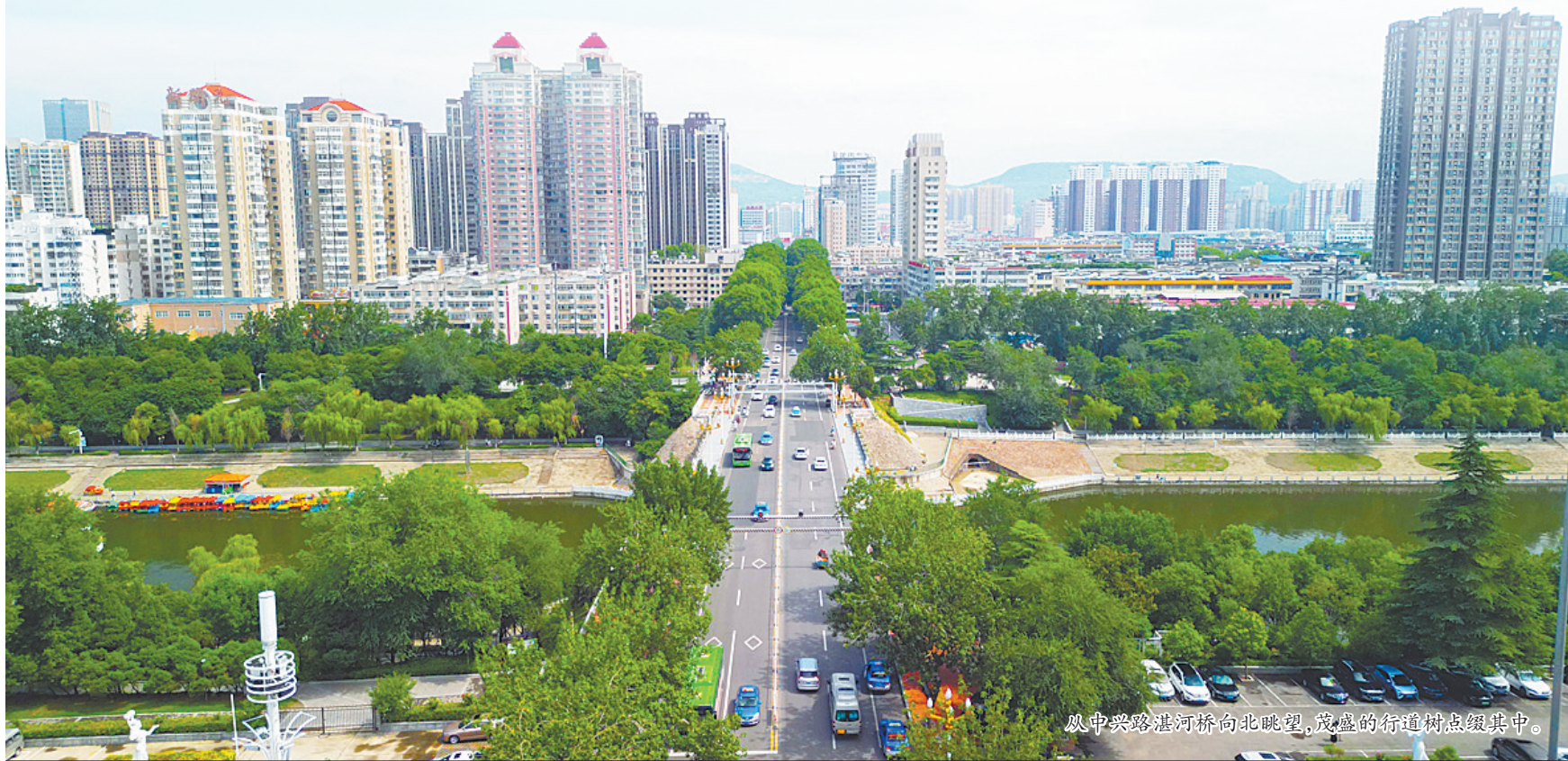
从中兴路湛河桥向北眺望，茂盛的行道树点缀其中。