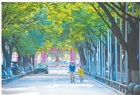
河滨公园东门，整齐排列的行道树为市民遮挡暑热。