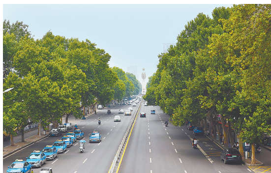
建设路东段，巨大的法桐树下一片阴凉。