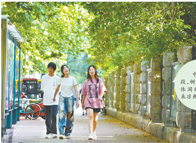
中兴路南段，树荫为漫步休闲的行人带来凉爽。