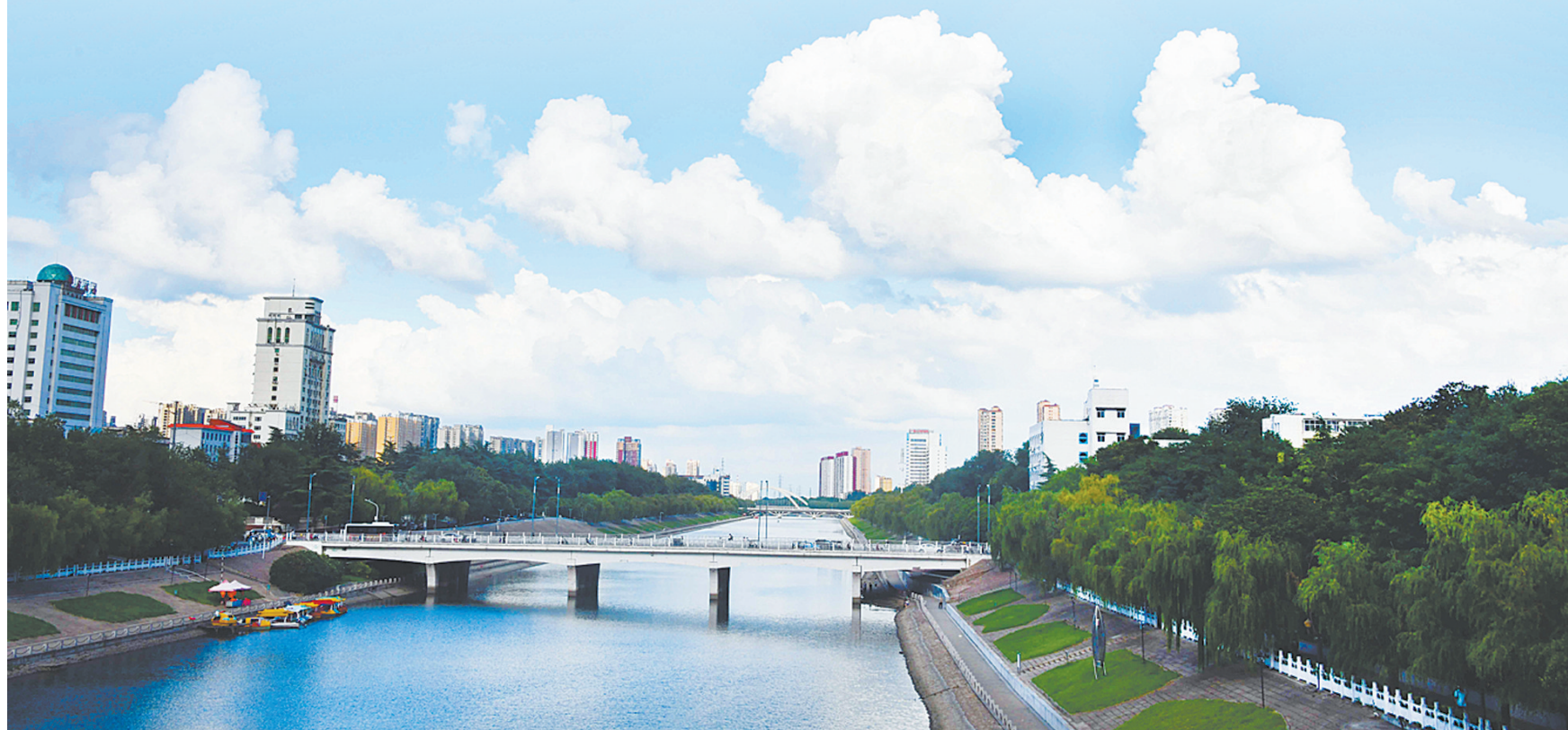
图⑦:白云蓝天入画卷(摄于开源路湛河桥附近)