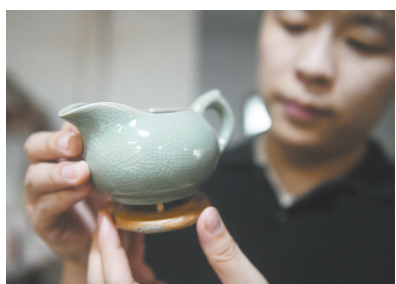
员工查看刚出窑的公道杯

中华汝瓷网以弘扬汝瓷文化、展示汝瓷瑰宝为宗旨,立足本地,面向全球,展示汝瓷大师的风采,展出了一大批汝瓷作品。“鼠标轻轻点,汝瓷网上现。”中华汝瓷网一面世即引发极大关注,新浪网对其上线进行了报道。随着中华汝瓷网内容的不断丰富,不少知名网站开始转载其网页和图片,为传播汝瓷文化搭建起了网络桥梁。