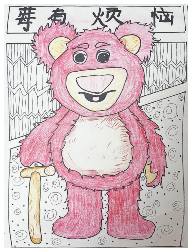
草莓熊 东湖学校四(1)班 杨岚轲