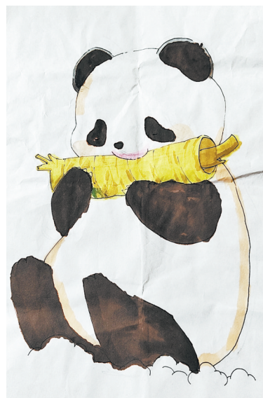
熊猫 东湖学校四(3)班 李沛宸 指导老师:樊燕军