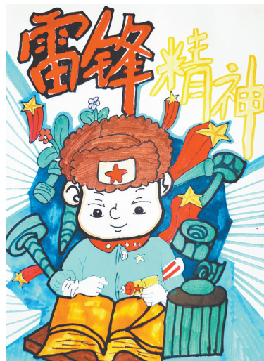
心中的榜样——雷锋 新华路小学教育集团明珠校区 四(3)班 郭沂菡 指导老师:陈颖颖