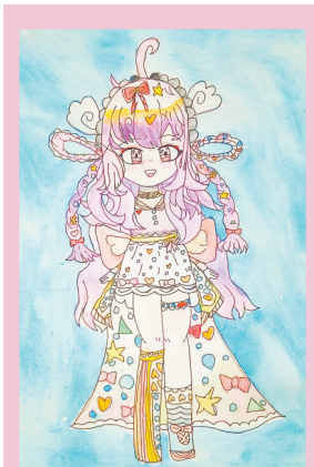
小女孩 中心路小学教育集团二(4)班 李熙桐