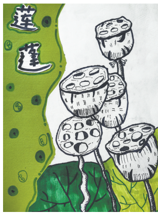
莲蓬 悦和园小学一(1)班 张照苒 指导老师:向世雯