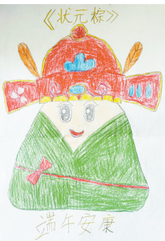
状元粽 中心路小学教育集团四(3)班 张舒俊