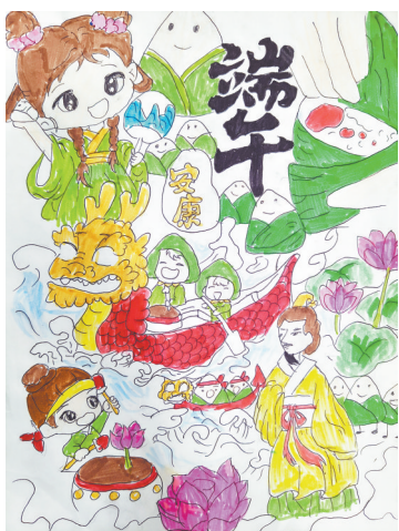
端午 四(2)班 杨兰琪