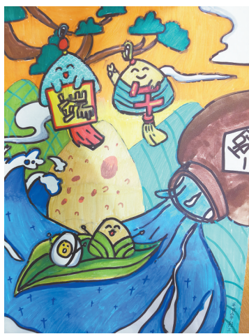
端午 四(2)班 董书华