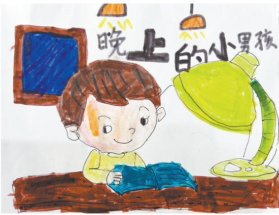
晚上的小男孩 一(4)班 冯景怡 (指导老师:景书娜)