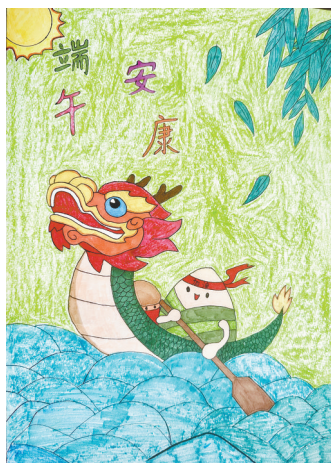
端午安康 三(1)班 陈毅然