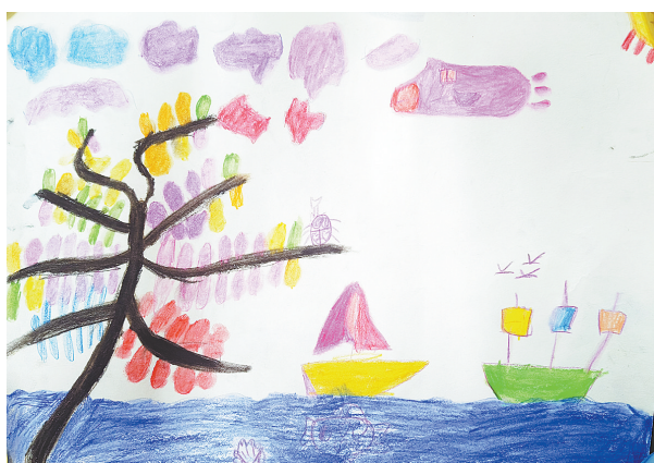
春日 一(2)班 张杜若 (指导老师:张燕)