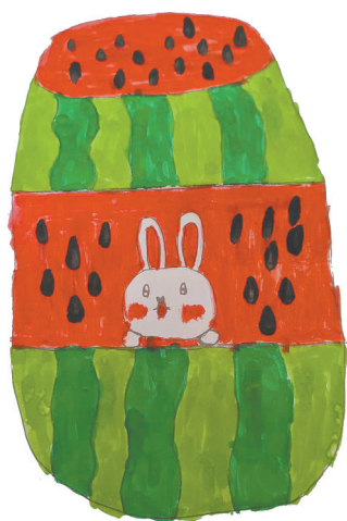
住在西瓜里的兔子