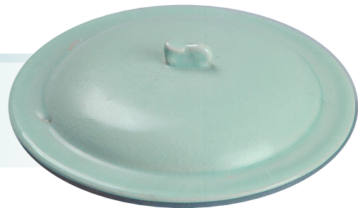
张公巷窑址出土的器盖(资料图片)

“纵有家财万贯，不如汝瓷一片。”2023年3月，纽约佳士得重要中国瓷器及工艺精品专场拍卖会上，两件汝瓷瓷片拍出9.45万美元的成交价。残片何以拍出这么高的价格？汝窑位居宋代五大名窑之首，汝瓷向来为收藏界的梦幻逸品，公认的传世汝窑瓷器，全球不足百件，乃至残片也难得一见。