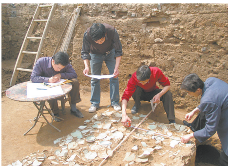
张公巷窑址3号探方清理现场(资料图片)

我国制作瓷器的历史悠久，早在商周时期就出现了原始青瓷，历经春秋战国时期的发展，到东汉有了重大突破。三国两晋南北朝后，南方和北方所烧青瓷开始各具特色。隋代瓷器仍以青瓷为主，烧瓷技术有所提高并创造出许多新的器型。唐代瓷器制作达到成熟，开创了“南青北白”的制瓷胜景。到了北宋晚期，得益于宫廷的青睐和日渐成熟的烧制工艺，汝瓷产品胎体、造型、釉色位于同期世界最高水平，奠定了中国陶瓷艺术与技术