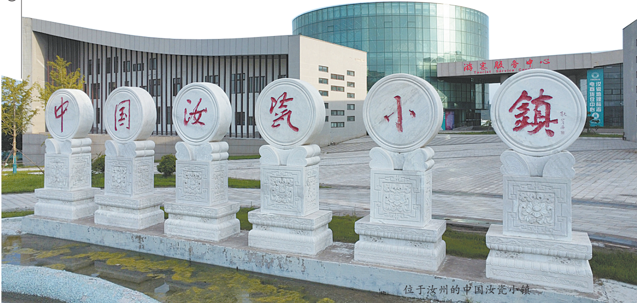
位于汝州的中国汝瓷小镇