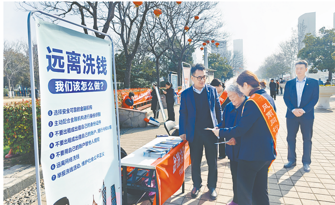
人保财险平顶山市分公司工作人员为老人讲解如何防诈骗

大地财险十项服务承诺为:365天×24小时专线畅通无忧,65天×24小时查勘,365天×8小时定损,10万元以下车险案件1个工作日内赔付,车险小额案件快赔,车险免上门交单,人伤温情关怀,全国通赔、就近理赔,365天×24小时非事故道路救援,承保理赔信息自主查询。