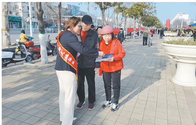
大地财险平顶山中支工作人员宣传消保知识