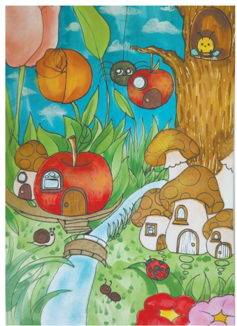
昆虫的家 光明路小学教育集团五(5)班 刘子涵

在那一刻，我突然感到自己长大了，已经不再是那个只会玩耍的小孩了。我学会了在紧急情况下冷静处理问题，懂得承担责任和关心、照顾他人。