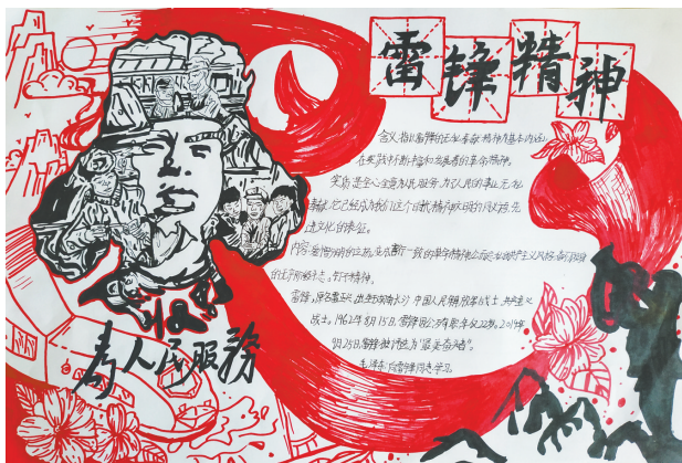
雷锋精神 锦绣小学六(4)班 张晓玉