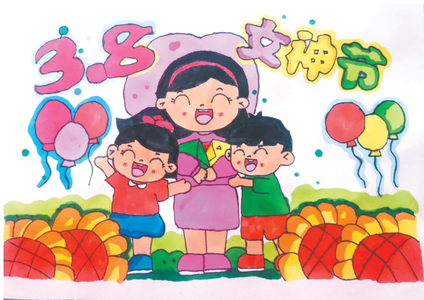
送给亲爱的妈妈 开源路小学五(6)班 朱君耀 (指导老师:张鸽)