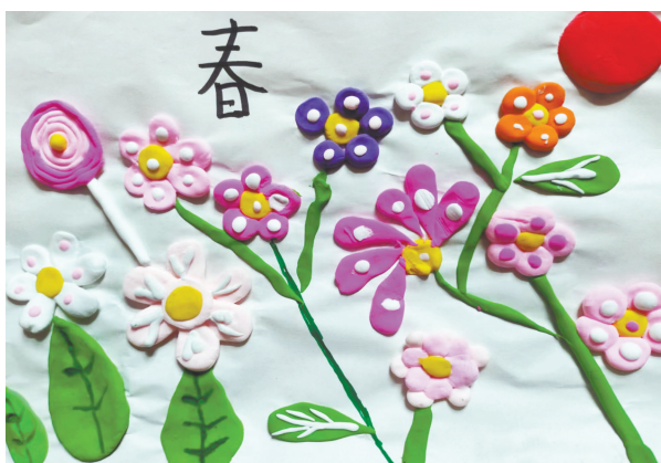
春 体育路小学教育集团一(2)班 邓子悦

春天来了！春天来了！我们一起去找春天！ 柳树上的点点嫩芽，那是春天的眉毛吧？ 迎春花露出灿烂的笑脸，那是春天的眼睛吧？ 喜鹊杜鹃叽叽喳喳的叫声，那是春天的歌声吧？ 碧蓝天空中的风筝，那是春天的舞蹈吧？ 教室里琅琅的书声，操场上的欢声笑语，那是春天的希望吧？ (指导老师:魏松鸽、丁晶)