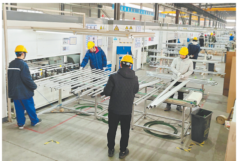
公司员工对铝边框材料进行全检