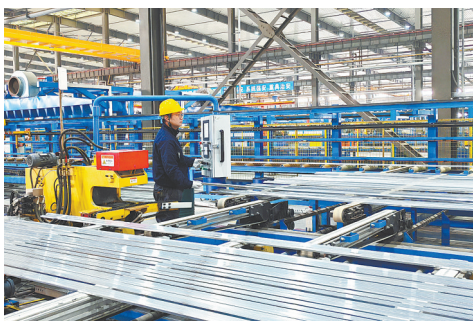
公司员工对铝边框材料进行调直