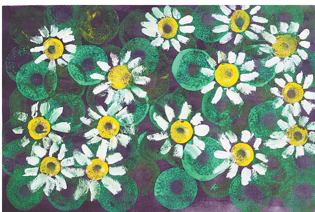
雏菊 五条路小学二(9)班 彭则铭