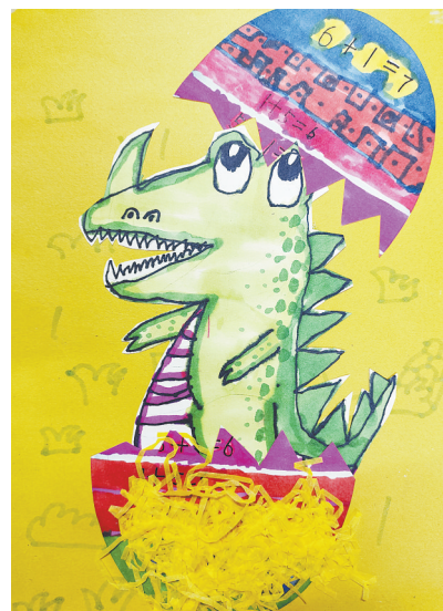
破壳的恐龙 轻工路小学四(1)班 许睿轩 (指导老师:朱颖新)