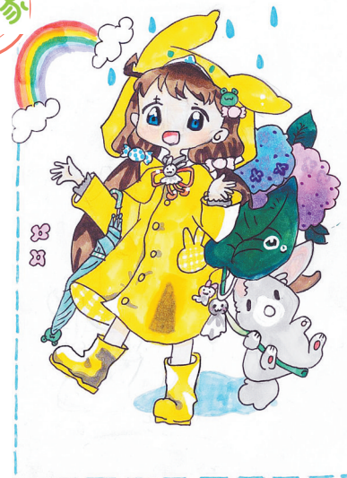
女孩 卫东区实验小学五(2)班 田欣冉