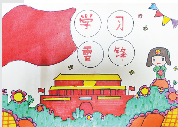
学习雷锋 建东小学四(5)班 李维洋(指导老师:葛红梅)