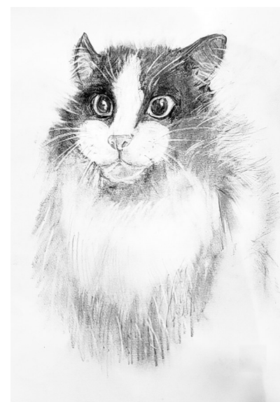
猫 矿工路小学五(2)班 赵甲博