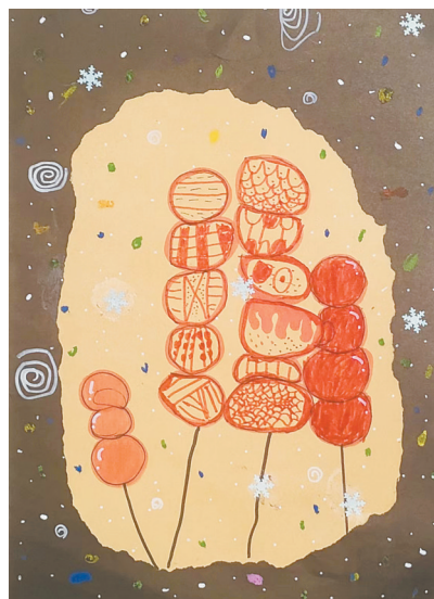
春节味道 建设街小学一(4)班 艾祥筠