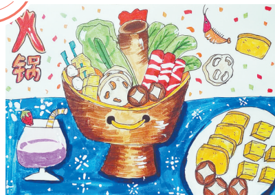
火锅 建设街小学三(5)班 周韩

这就是我们家的小乌龟,我非常喜欢它,因为它给我带来许多的乐趣。(指导老师:王凯芳)