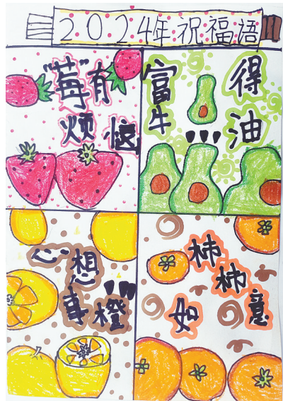
祝福语 新程街小学教育集团一(2)班 岳欣冉

捶丸运动是古代人民智慧的结晶,同时也是我国为数不多的体育运动项目存在的证明。通过参加这次活动,我感受到了家乡悠久的历史。平顶山,我为你骄傲。(指导老师:周矿生)