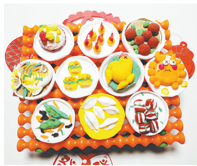
年夜大餐 新程街小学教育集团二(3)班 朱玥瑶