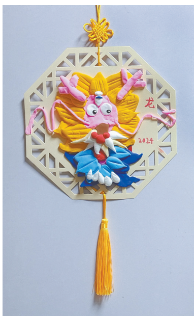
龙行龘龘 一(2)班 张琳瑄 (指导老师:马静怡)