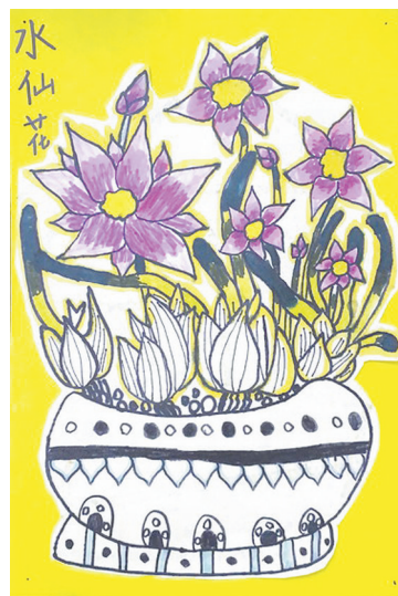
水仙花 二(3)班 刘奥淇 (指导老师:张亚春)