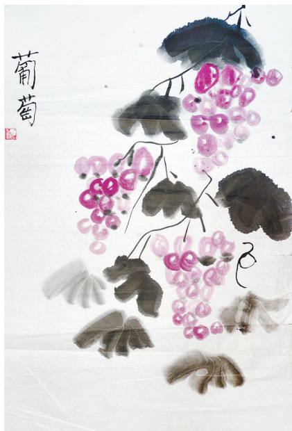
葡萄 四(3)班 郭芮