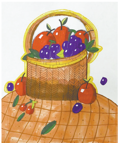
果篮 二(3)班 王紫涵 (指导老师:张亚春)