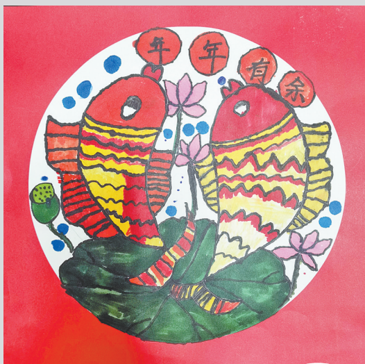
年年有鱼 三(3)班 王艺潼