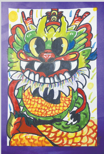
龙 三(3)班 曹汀禾