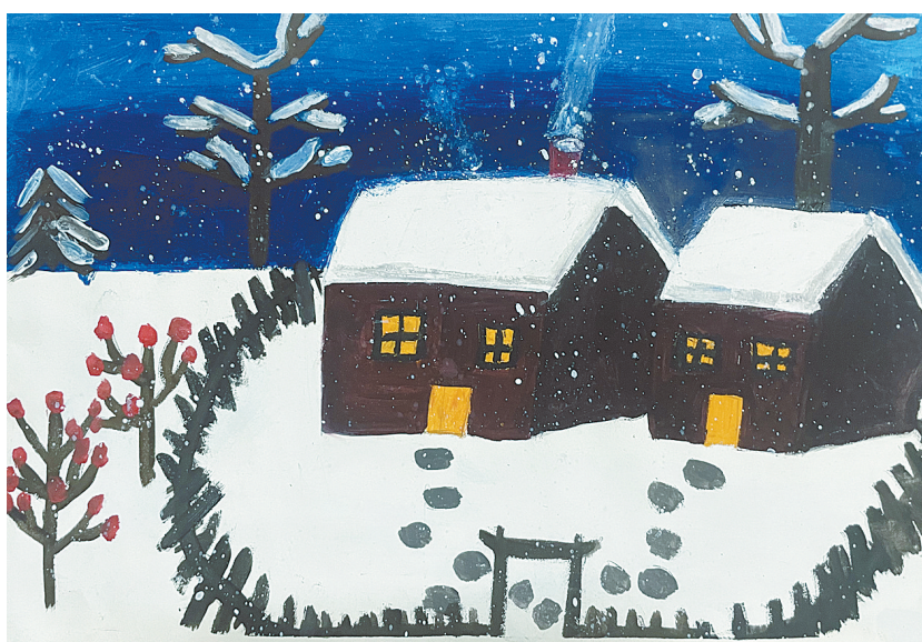
雪景 雷锋小学教育集团四(8)班 赵梓妍 (指导老师：王锐军)