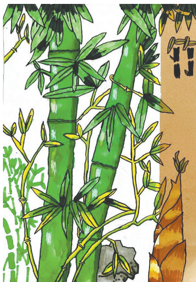
竹 公明路小学二(5)班 王稳兴 (指导老师：宗玮玲)

回到家之后，看见全家的照片，哦！我想起来了，奶奶已经去成都照顾弟弟、妹妹了。我太想奶奶了！