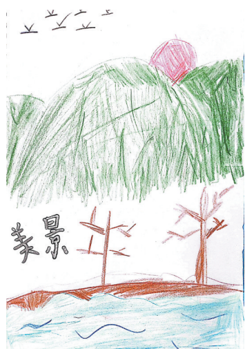
美景 建东小学二(1)班 刘玥涵

“坐好,我们走喽!”爷爷的话惊醒了沉思的我,我真想对他说:“谢谢您,爷爷!您给了我温暖,给了我快乐,也给了我满满的爱!”(指导老师:韩俊鸽)