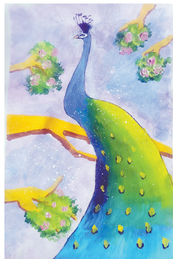
孔雀 轻工路小学五(2)班 张艺琳 (指导老师:张芳辉)