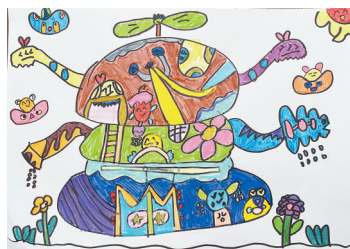
汉堡城堡 沁园小学二(5)班 刘子文 (指导老师:胡雨馨)