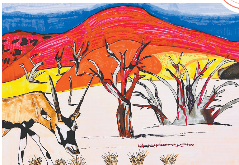
纳米比亚沙漠 新程街小学教育集团四(5)班 丁熠博