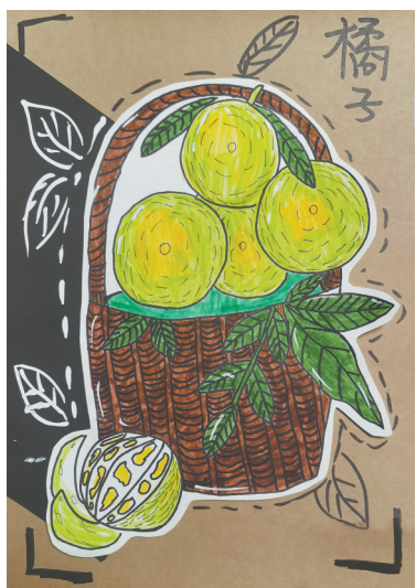
水果写生 雷锋小学教育集团二(5)班 王艺冰