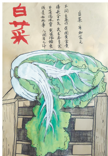
白菜 雷锋小学教育集团五(7)班 杨晨旭 指导老师:汪东枝