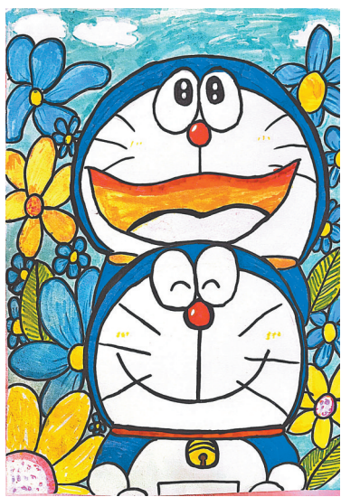
公园里的哆啦A梦 翠林蓝湾小学四(2)班 孟美莹