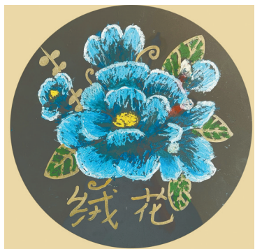
绒花 湖光小学三(一)班 韩程真