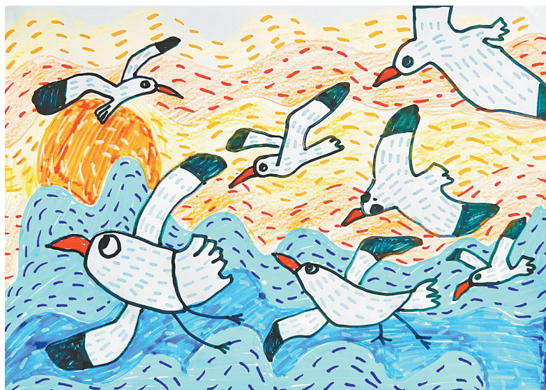
白龟湖落日 公明路小学二(3)班 卢鲲淇