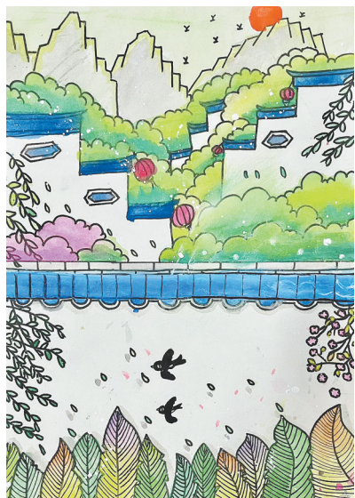
古色古香 东环路小学四(5)班 苗益璋