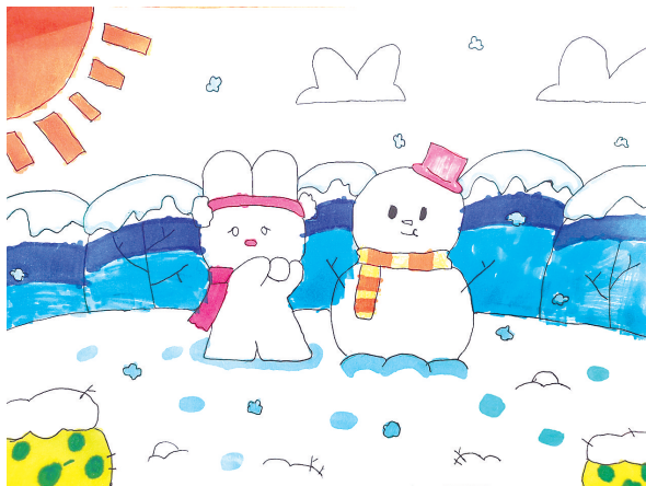
雪人 福佑路小学二(4)班 王曼阁 (指导老师:杨超楠)