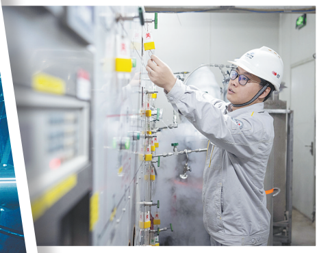
日前，上海交通大学PandaX实验组成员在锦屏大设施调试实验设备。