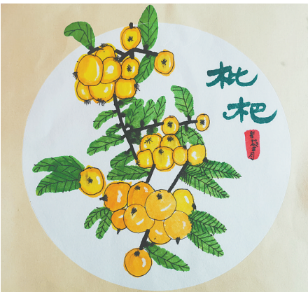
枇杷 二(5)班 崔馨月 指导老师:宋举