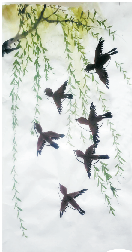
晨曲 一(14)班 蔡润禾