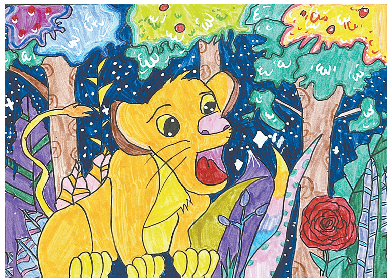
狮子王 三(4)班 郭娅祎