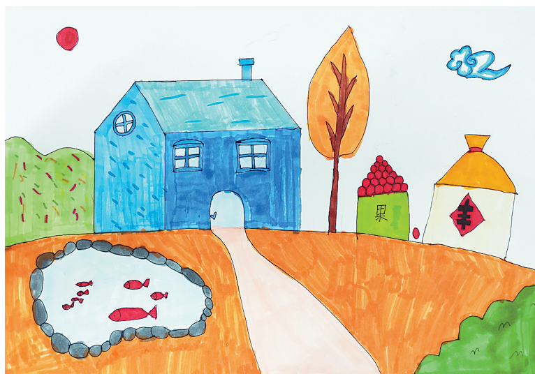
金秋 公明路小学三(2)班 郭宸熙 (指导老师:翟亚凡)

冬天，构树只剩一根光秃秃的树干，但它并不感觉到孤独，也不会悲观，因为它知道，明年春天一来，自己就会重新变得生机勃勃。