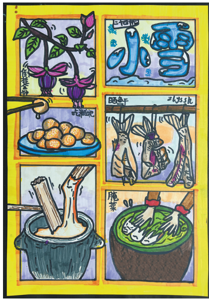
二十四节气小雪 新华路小学三(3)班 尚乙然