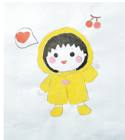
小女孩 南环路小学四(5)班 杨悦然