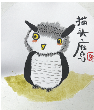
猫头鹰 稻香路小学二(5)班 张莹汐