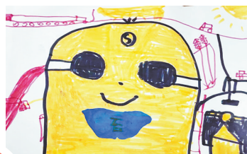
小黄人 建设街小学三(5)班 支俊宇