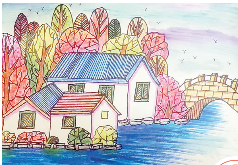
风景 平马路小学五(5)班 张雨泽

活动最后,我们戴上VR眼镜,体验了一把“井下漫游”。这次参观活动彻底颠覆了我们对采煤的传统认知,当智能化煤炭开采技术直接展现在面前,我们深深地体会到采煤科技的先进和煤矿工人的辛苦,更加激发了我们努力学习、探索新知的决心,将来造出更智能化的采煤机械设备,让煤矿工人的工作环境更安全、更舒适。