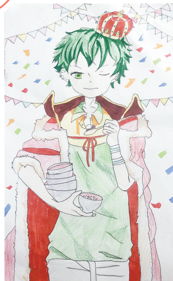
漫画 湛河区实验小学四(10)班 潘昕彤