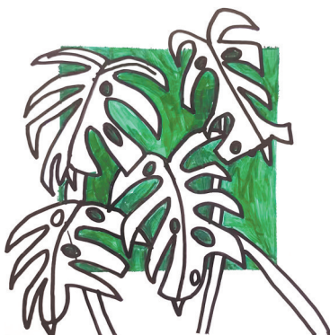
龟背竹 新程街小学教育集团二(1)班 樊宸楷