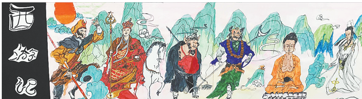
西游记 开源路小学六(6)班 段程翔 (指导老师:张伟华)