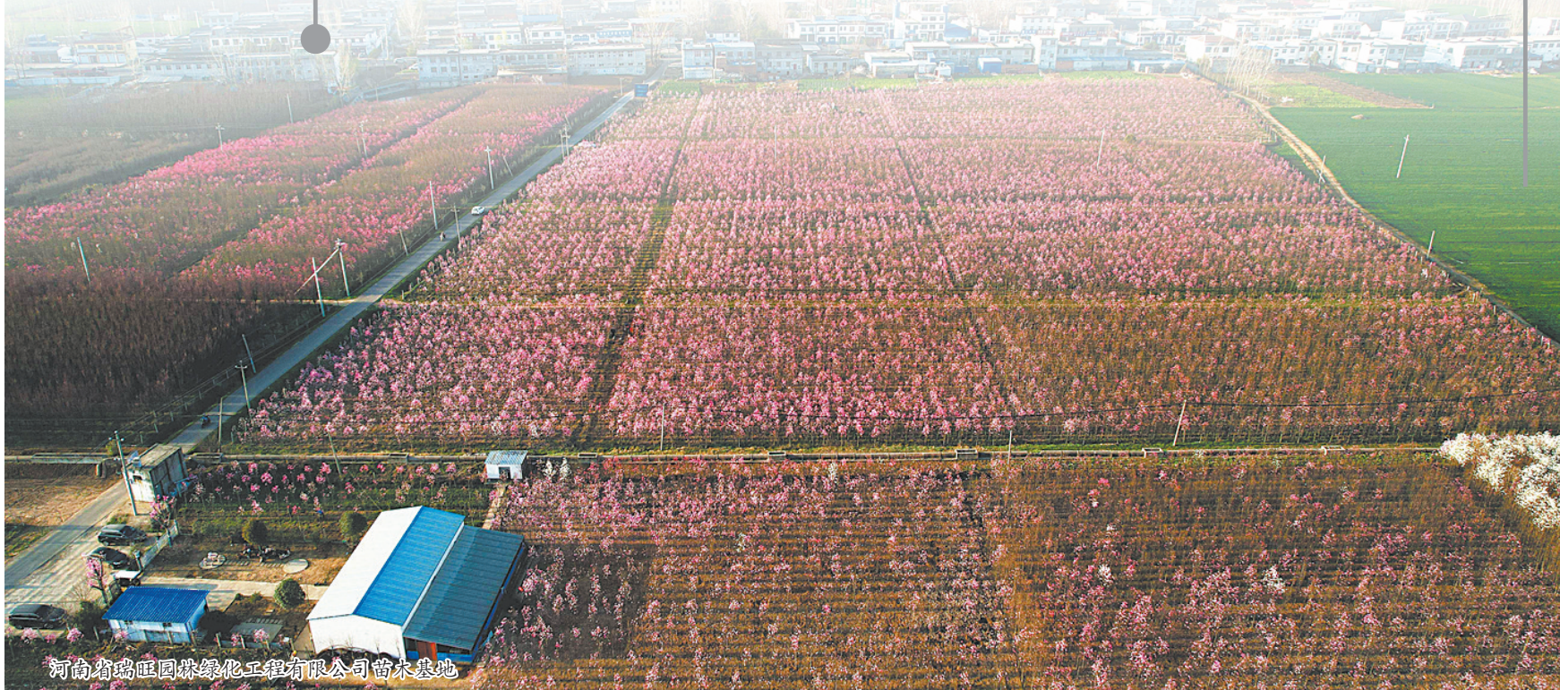
河南省瑞旺园林绿化工程有限公司苗木基地