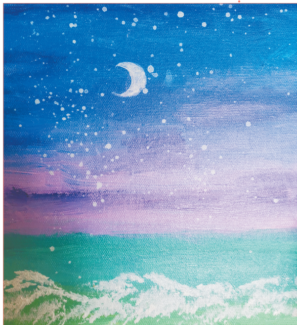
夜空 三(4)班 马凝希