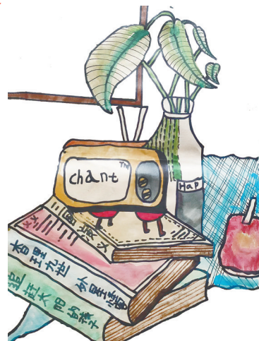
书桌 雷锋小学教育集团四(7)班 杨晨曦(指导老师:汪东枝)

我爱我的老师,我长大了也想成为她这样的人,成为可以带给别人光和热的人!(指导老师:韩晓花)