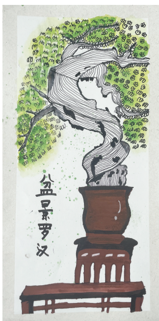
盆景罗汉 雷锋小学教育集团三(8)班 赵梓妍