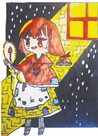
卖火柴的小女孩 湛河区实验小学三(10)班 化译文