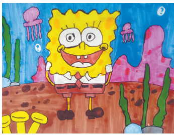
海绵宝宝 新程街小学教育集团三(4)班 丁俊萌