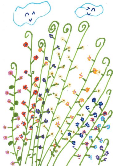
孔雀花 中心路小学教育集团一(3)班 董航宇