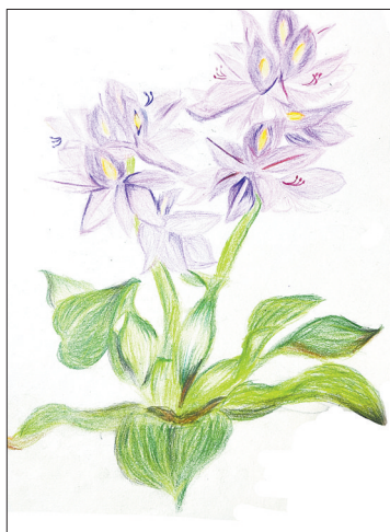
凤眼莲 三(3)班 马梓睿

蚂蚁的团结精神让人赞叹不已。回家后,我跟妈妈分享了这件事情,妈妈也不禁感叹“果然团结就是力量”。这件事也让我明白:遇到再大的困难,只要一群人齐心协力,就会很轻松地完成。