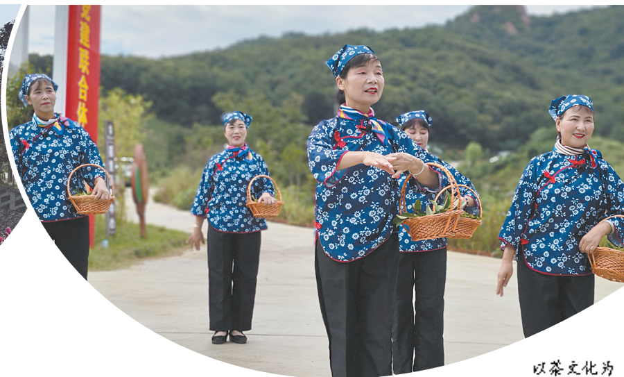
以茶文化为主题的文艺节目