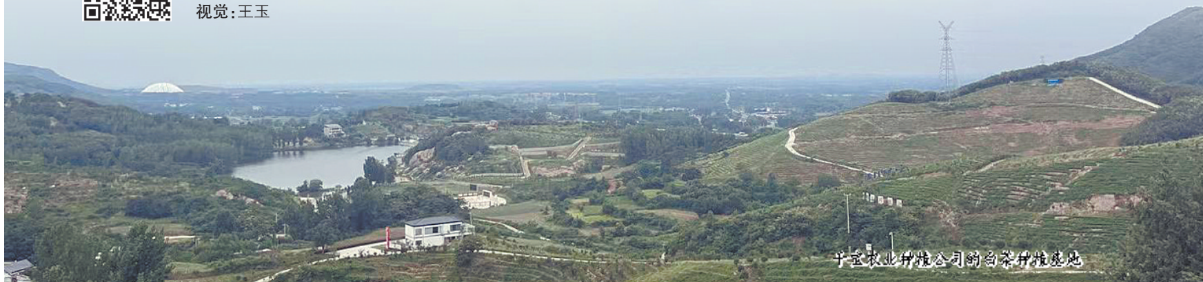
千宝农业种植公司的白茶种植基地