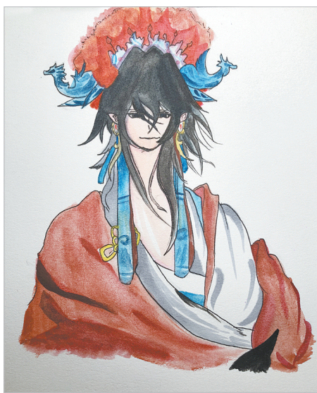
变脸 开源路小学五(6)班 段程翔 指导老师:张伟华