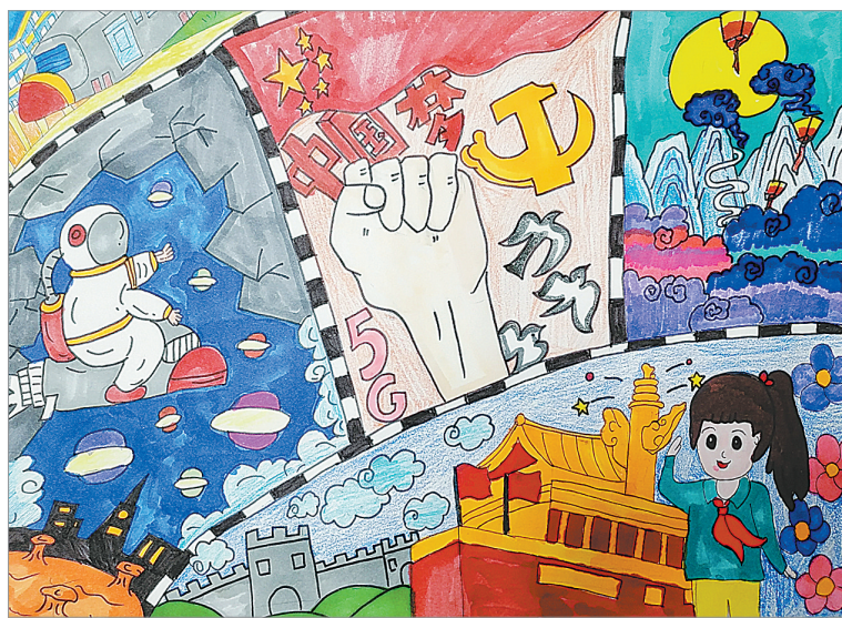
童心向党 锦绣小学四(2)班 鲁筱楠 指导老师:杨艳峰