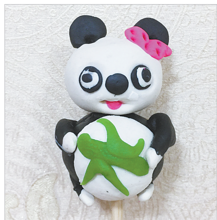
面塑大熊猫 体育路小学教育集团一(7)班 刘芷含