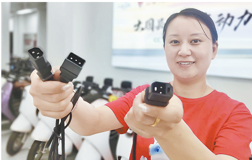
市区平安大道中段一家电动车销售店，店员展示插头。

电动车充电器的标准不统一，不同品牌和型号的充电口和插头互不兼容，给消费者带来不少麻烦。7月1日起，电动车充电器正式实施“强制性国家标准”（以下简称“国标”），对电动车充电器作出统一要求。我市的电动车销售及维修市场对“国标”落实得如何，7月11日、12日，记者进行了走访。