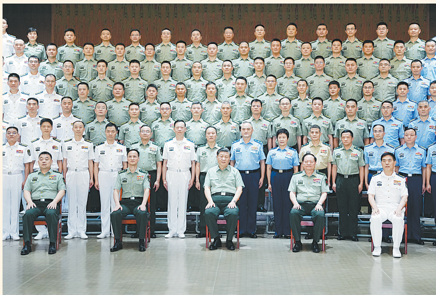
7月6日,中共中央总书记、国家主席、中央军委主席习近平视察东部战区机关,代表党中央和中央军委,向东部战区全体官兵致以诚挚问候。习近平发表重要讲话并亲切接见东部战区官兵代表,同大家合影留念。

新华社南京7月6日电(记者梅常伟)中共中央总书记、国家主席、中央军委主席习近平6日视察东部战区机关,代表党中央和中央军委,向东部战区全体官兵致以诚挚问候。他强调,要深入贯彻党的二十大精神,贯彻新时代党的强军思想,贯彻新时代军事战略方针,锚定建军一百年奋斗目标,努力开创战区建设和