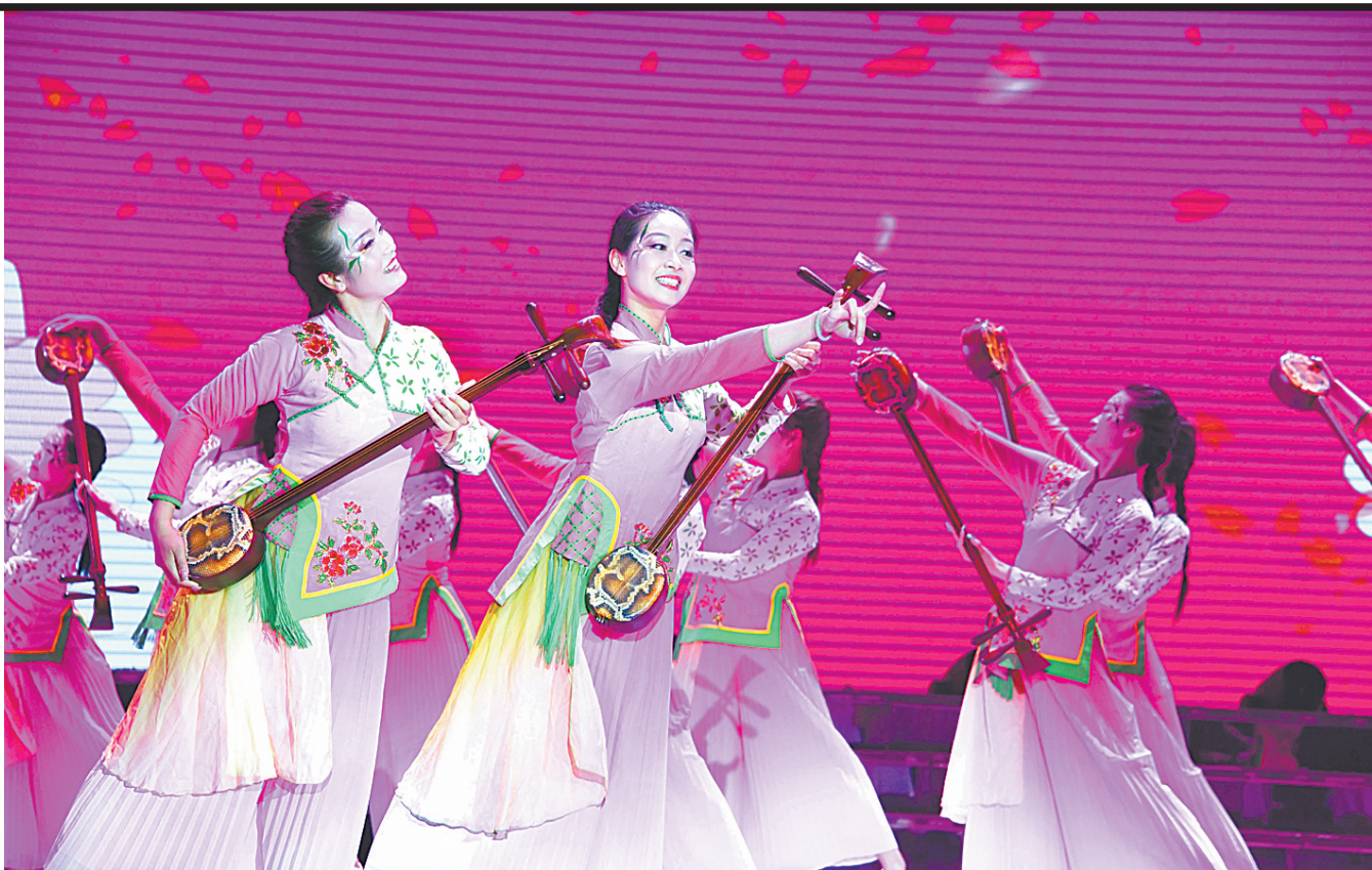
曲艺乐舞《弦书道出幸福来》