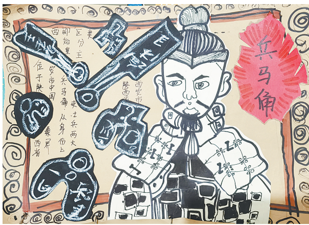
兵马俑 公明路小学三(3)班 张家铭 指导老师:郑兴乐