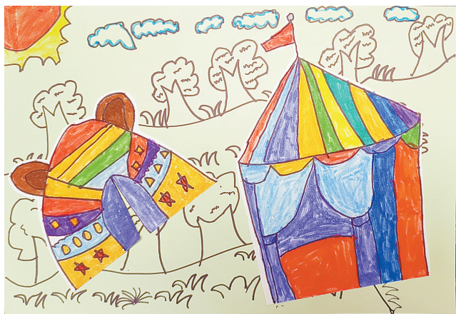
露营 公明路小学二(1)班 余昊泽 指导老师:关文菲