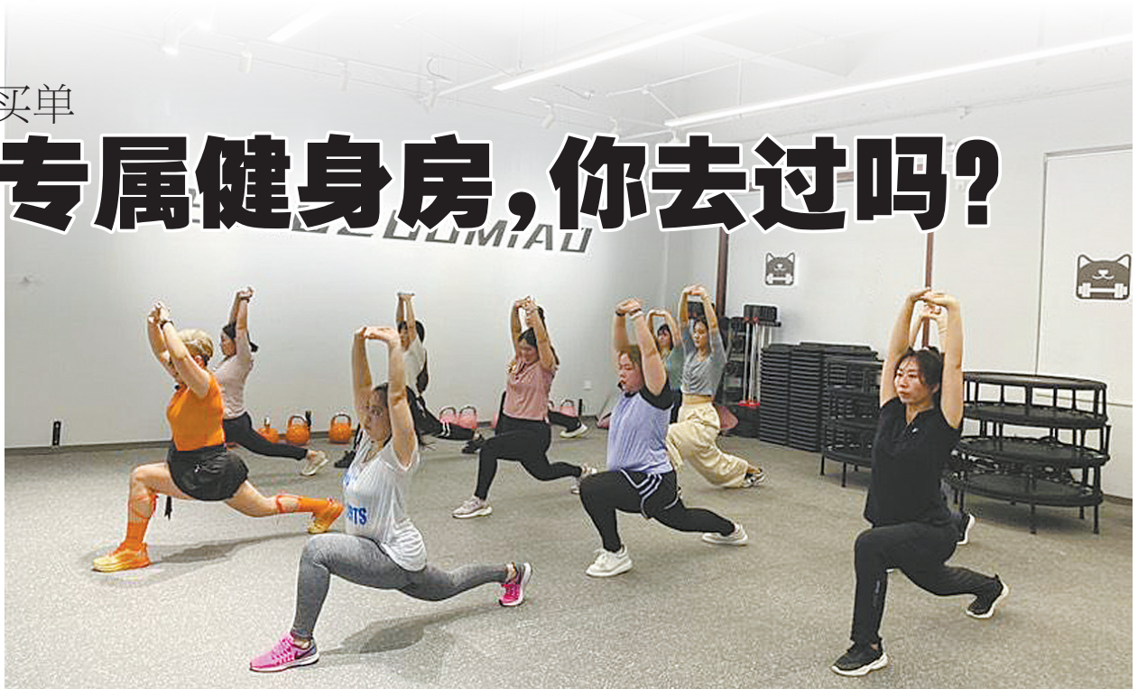
不少女生在这里运动健身。

近日,记者走访发现,随着越来越多的女性加入健身队伍,健身行业也出现细分服务,更能照顾到女性隐私,且课程设置上更关注女性训练需求的专属健身房逐渐在鹰城兴起。