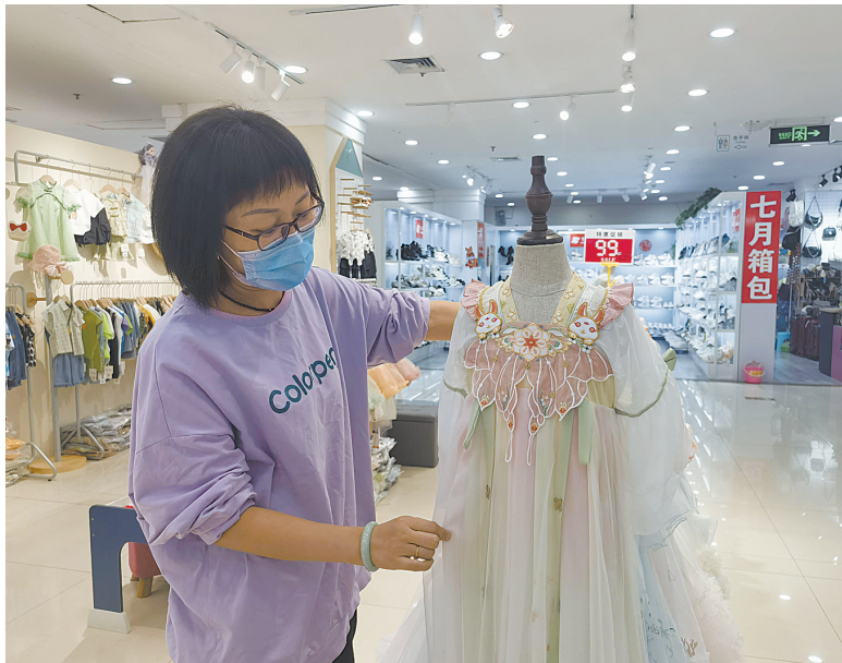
市区和平路步行街一家童装店,店员展示汉服裙子

本报讯 一年一度的儿童节快到了,各种庆祝演出纷至沓来,带动与节目表演相关的童装市场也热了起来。