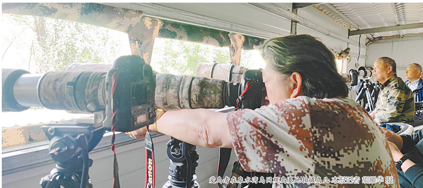
爱鸟者在泉水湾鸟网观鸟基地拍摄鸟儿

目前，全市林业用地面积430万亩(1亩≈66667平方米)，有林地面积2926万亩，林木蓄积量1205万立方米，森林覆盖率24.75%，林木覆盖率35.1%。森林氧吧为鸟儿提供了良好的生态环境，吸引更多鸟儿“落户”。