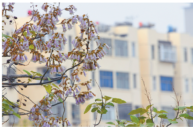
市区湛河南路中段，桐树开花美街头。