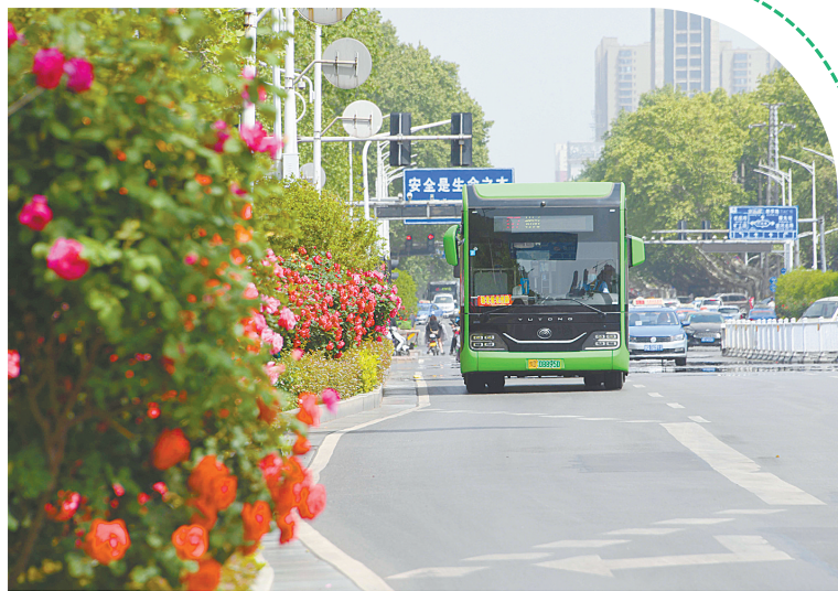
市区建设路中段，月季花竞相开放。