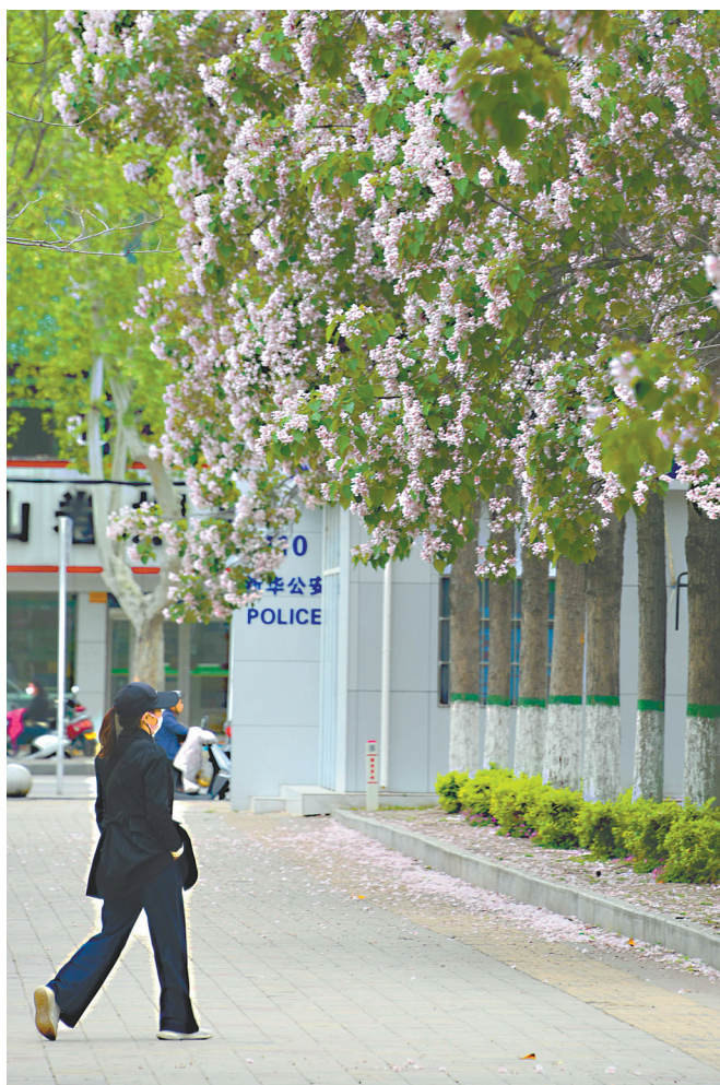
市区长青路街头，楸树花开，簇簇芬芳挂满枝头。