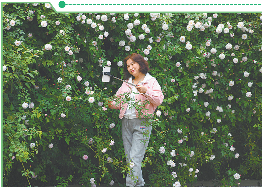
市区湛河北路中段蔷薇花开正艳，成为市民拍照打卡网红地。