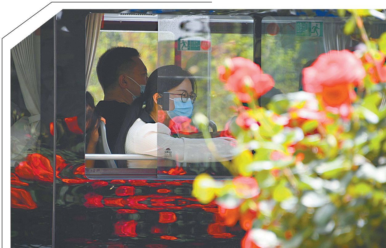
市区建设路中段，乘坐公交车的女孩目光被鲜花吸引。