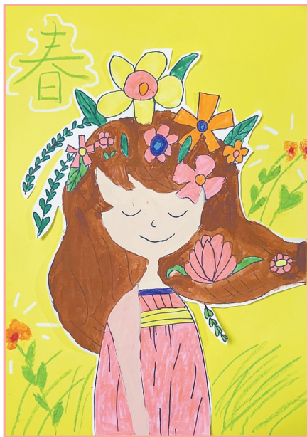
春 三(3)班 姜莱