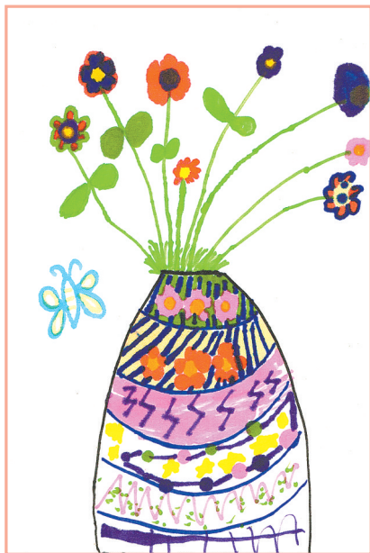
漂亮的花瓶 一(3)班 董航宇