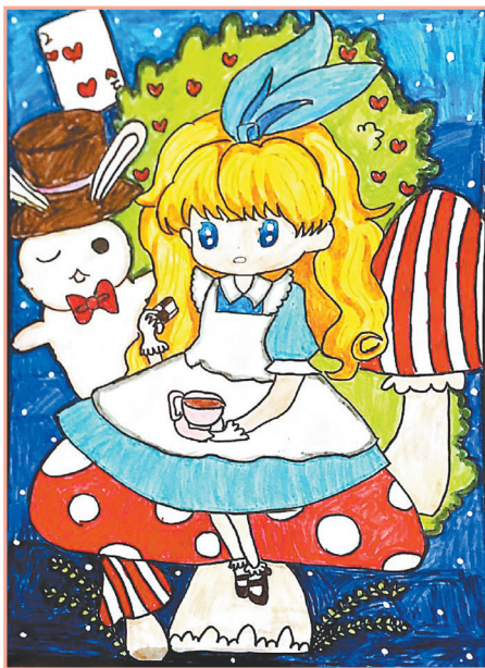
爱丽丝梦游仙境 四(1)班 马铭玥