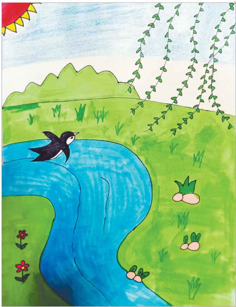
杨柳依依 开源路小学二(6)班 彭婉婷 指导老师:周晓丽