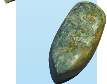
石镰(上)和石齿