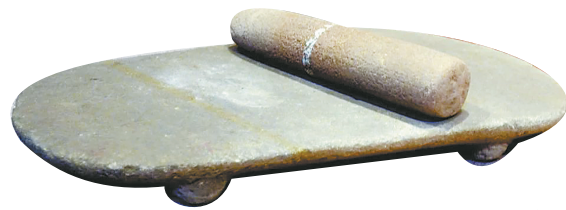
石磨盘和石磨棒

魏如江说，以上三期遗存器物的变化，以器耳最为明显，一期器形较简单，耳稍下垂；二期器形较复杂，器耳多为规则的半月形；三期以折肩折腹的双耳壶为代表。至于出土的石敲砸器，两侧有缺口的石刀、石铲、假圈足陶碗、敛口钵、深腹盆以及彩陶等，与后来仰韶文化的同类器物很接近，表明两者具有密切的渊源，同时也体现出水泉遗址年代久远。