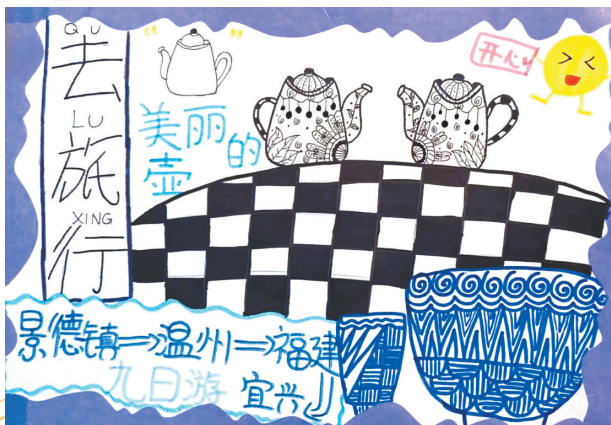
去旅行 翠林蓝湾小学三(6)班 张奥雪