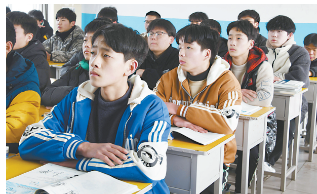
↑三胞胎兄弟认真听讲