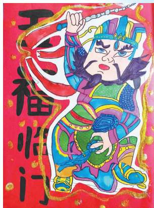
门神 体育路小学教育集团四(4)班 吴昀轩