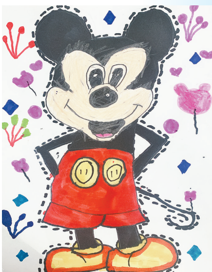
米奇 体育路小学教育集团三(七)班 钟昕艺