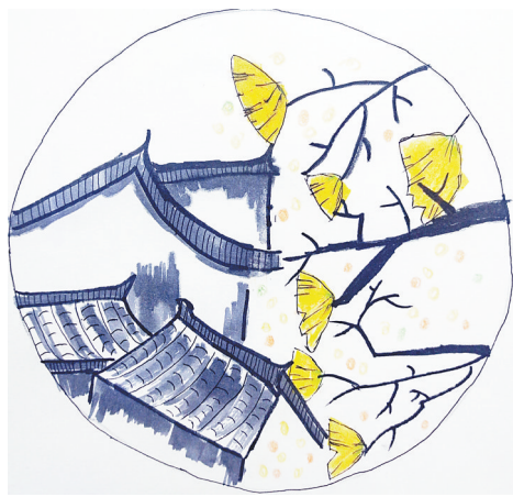
银杏叶 开源路小学四(6)班 魏晨伊