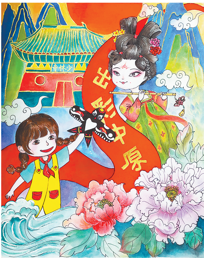
出彩中原 光明路小学二(2)班 李羽墨