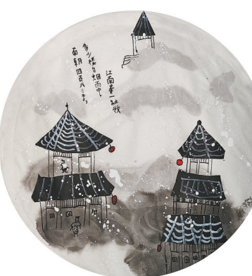
烟雨楼台 新程街小学三(1)班 何昊辰