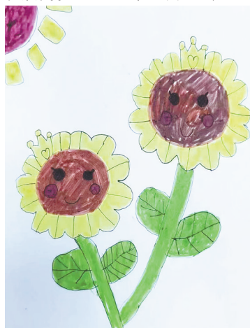
向日葵 建设街小学二(4)班 徐若涵