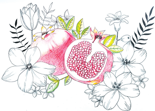
石榴 中心路小学五(6)班 赵子伊