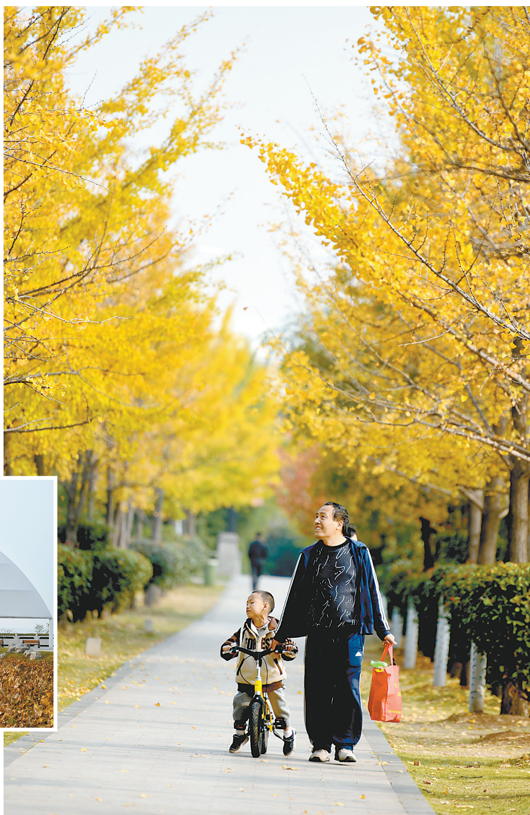
家长带着孩子欣赏美景