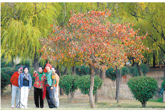
市民在火红的树下合影